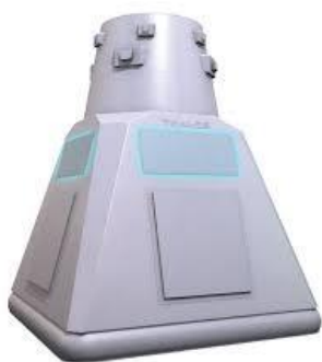
APAR Blik 2